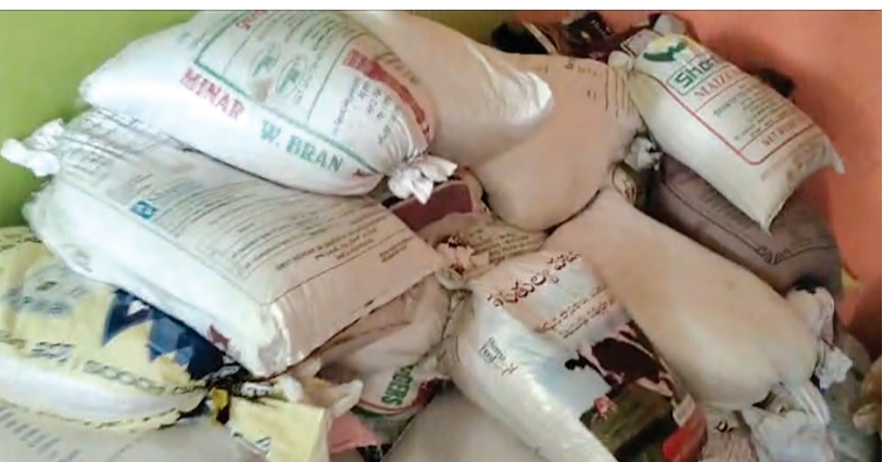
అంధ్ర, తమిళనాడు ప్రాంతాల్లో నుంచి సేకరించిన రేషన్ బియ్యంను అక్రమంగా నిర్వహించిన ఓ